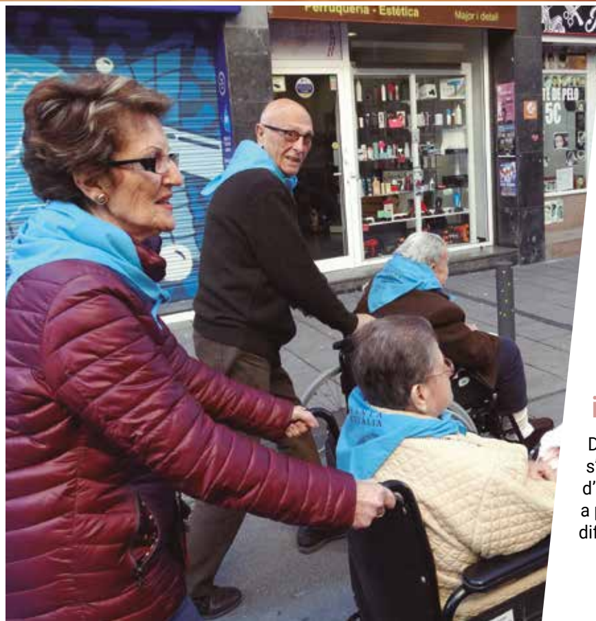
Dos voluntaris col·laborant en una de les sortides matinals dels nostres usuaris.