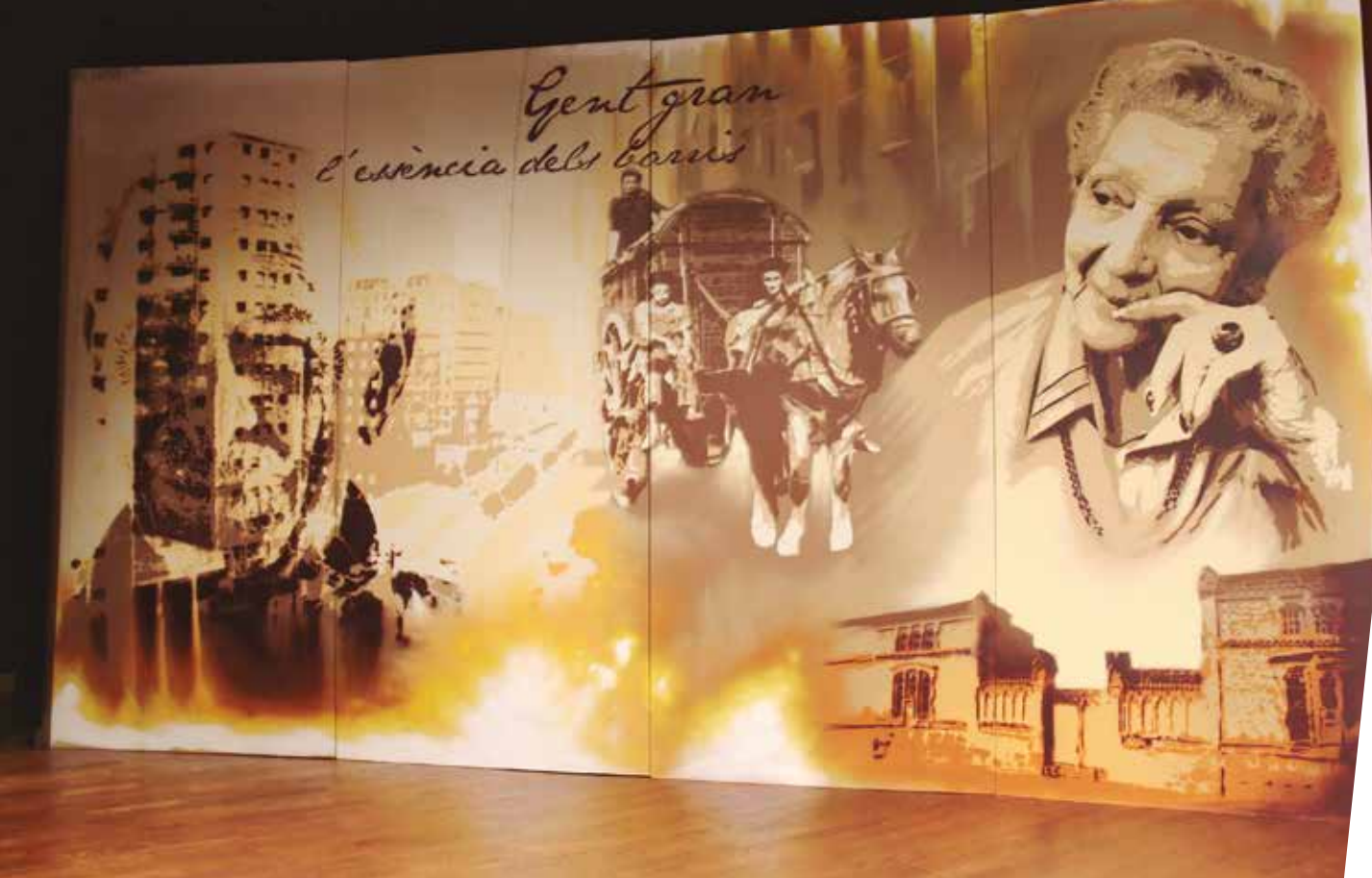
El mural "La gent gran, l'essència del barri" de l'artista Roc Blackbloc, presentat durant la Diada Eulalienca.